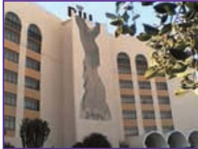
Miles de viviendas en toda Andalucía han sido construidas con Mormix

El Mormix es ideal para los enfoscados, tan característicos de la construcción en Andalucía