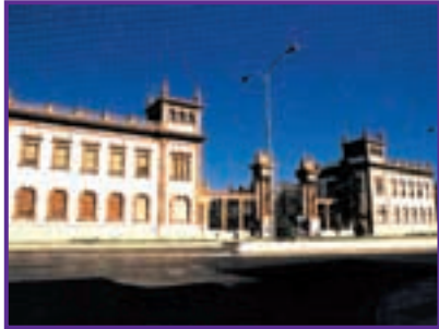
Tabacalera de Málaga

El Mormix es ideal para los enfoscados, tan característicos de la construcción en Andalucía