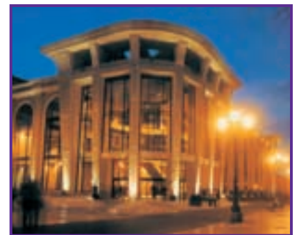
Una de las obras más emblemáticas es el Palacio de Congresos Príncipe Felipe

Actualmente la empresa ha obtenido los sellos de calidad INCE AENOR.